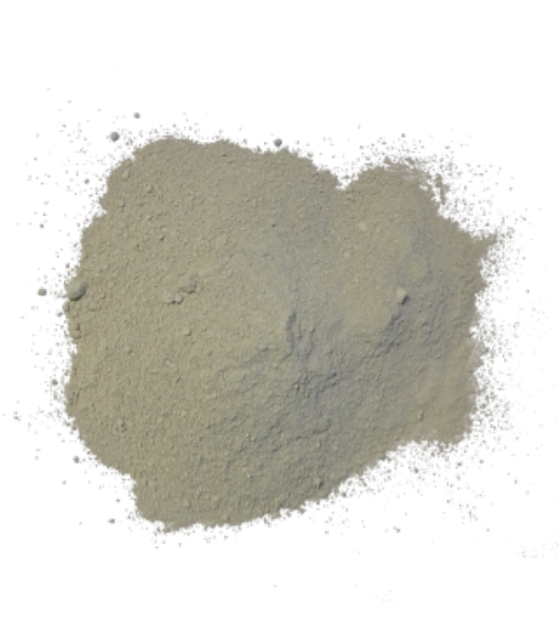
Рис. 4. Продукт истирания