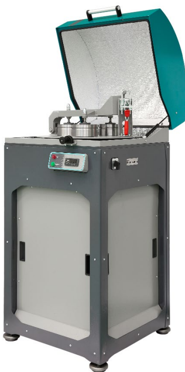
Рис. 1. Истиратель вибрационный ИВ 3М с тремя Чашами V 400