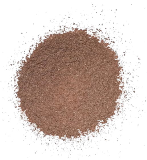
Рис. 3. Материал до истирания